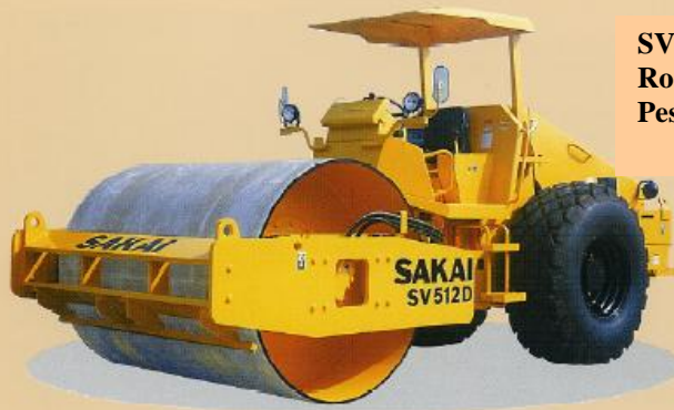
SV512D Rodillo liso Peso Neto 10.5 ton (23.150 lb.)

Poderoso Vibrocompactador que reduce los costos de operación en proyectos de movimiento de tierras a gran escala