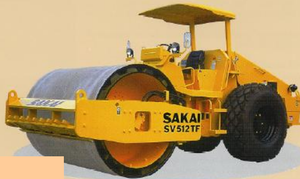
SV512TF Rodillo pata de cabra removible de rodillo liso Peso Neto 13 ton (28.660 lb.)